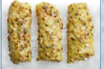
MSC Sommerbrise (Hoki = Dorschart-Lemonmarinade)