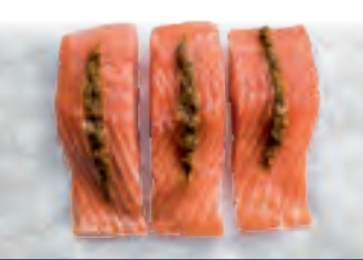
Lachsfilet Portion mit Tomaten-Kräuter-Tatar