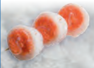
Lachs-Pangasius Rölleli (natur)