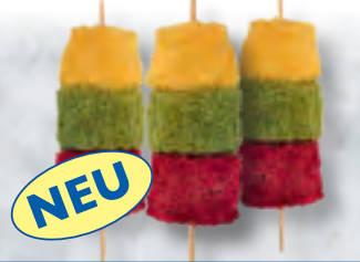
ASC Tricolore-Spiess (Buntbarsch, 3 verschiedene Panaden)