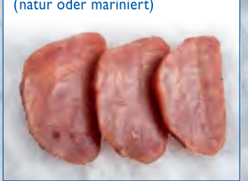
Thunfisch Portionen (natur oder mariniert)