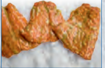
Lachsflügeli (leicht geräuchert und mariniert)