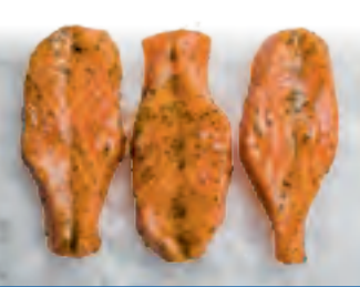
Segler Steak (Lachs)