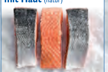
Lachsfilets Portionen mit Haut (natur)